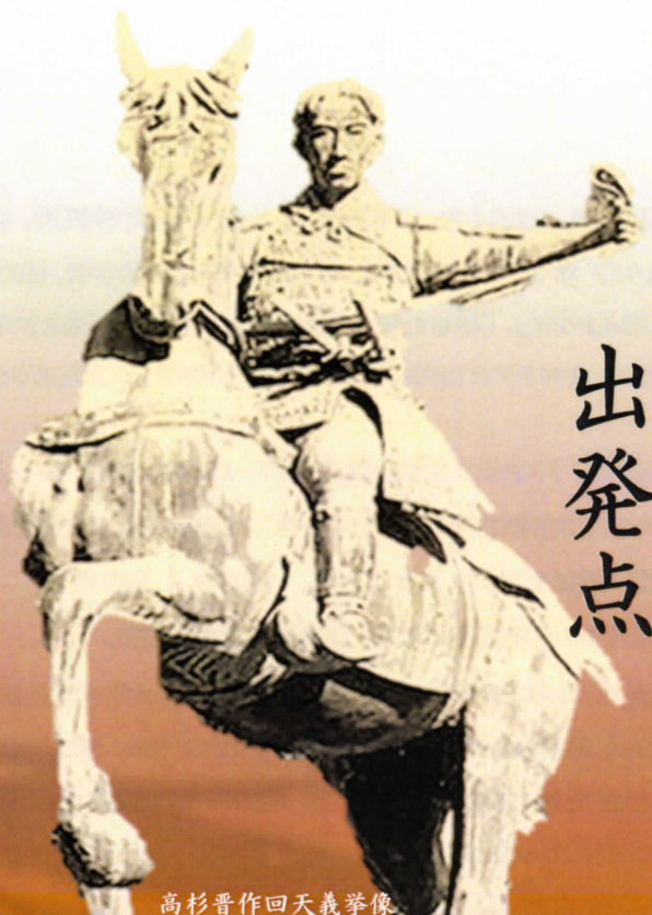
高杉晋作回天義挙像